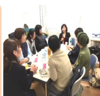
すまいる俵町のアロマ教室開催の様子

日頃から組合員さんと一緒に商品の使い方や、料理の仕方、世間話など楽しい会話をしています。1月は「すまいる有福と俵町」で「アロマスプレー作り」でした。2月は「丸きんまんじゅう」さんです。お楽しみに！