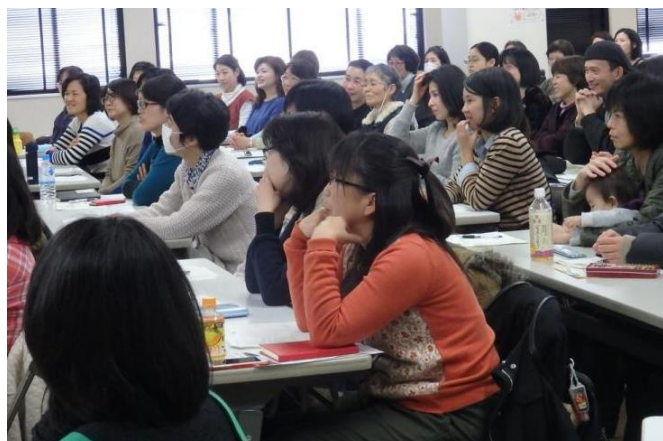
参加者は熱く楽しいお話に引き込まれました！