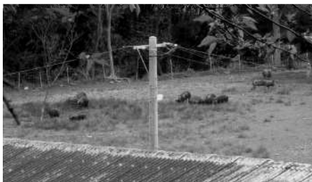
放牧黒豚は元気に遊んでいました。