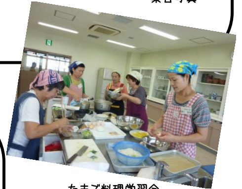
たまご料理学習会