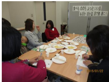
楽しく交流できました

女性が気になる「冷え」と「食」がテーマで、赤ちゃんと連れの若いお母さん方をはじめ幅広い年齢層の参加がありました。寒いこの季節に女性を悩ませる冷えを改善する為に、体を外から温めるだけでなく、食や運動・入浴や睡眠などの生活習慣の中で内側から温めていくコツなどを紹介しました。また、「食べもの」の話では、体は食べた物でできているので、「どんな原料」で「どうやって作られている」のかが大事なことで、グリーンコープのこだわりや食品添加物についての説明をしました。その後、グリーンコープ商品と市販品の食べ比べをしながら賑やかに交流でき話し