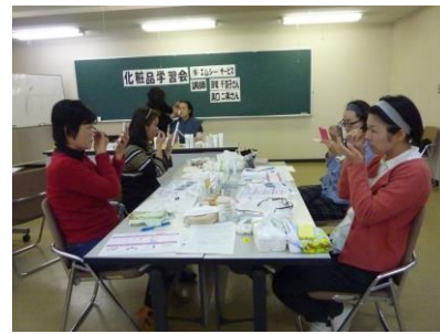
みんなできれいになりました