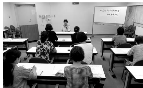
▲ワーカーズふたばの設立総会