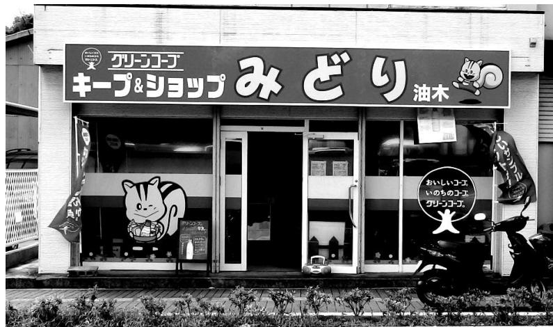
キープ&ショップ駐車場3台