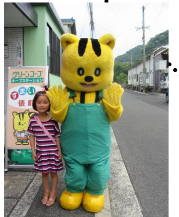
元気くんが遊びにきたよ!