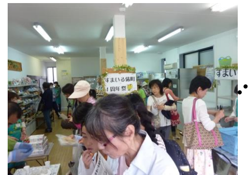
店内も混雑するほどにぎわいました!!