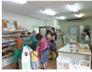
産直びん牛乳の試飲コーナー