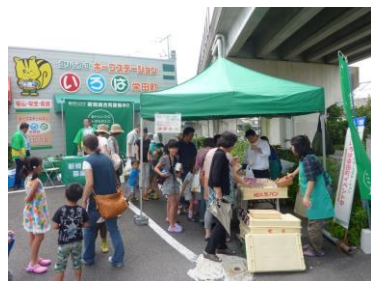
堀江製パンのおいしいパンですよ~!