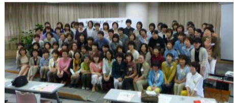
ワーカーズ全員集合!