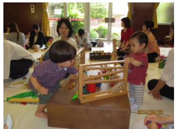
子ども達は世界のおもちゃにくぎづけでした