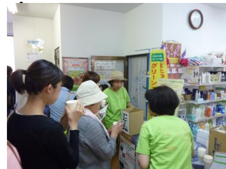
産直びん牛乳の試飲も大好評!