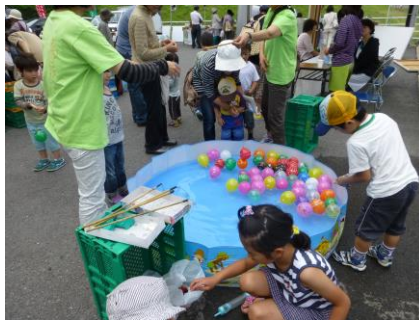
子どもに大人気のヨーヨー釣り