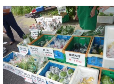
大好評の産直野菜販売