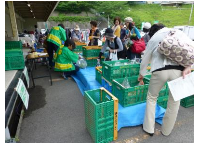
青果販売も大好評!