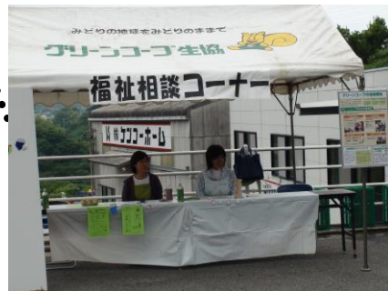
福祉ワーカーズどんぐり