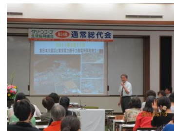
昨年の総代会の様子

2014年度第35期通常総代会が 長崎商工会議所で開催されます。総代 のみなさん参加して下さい。