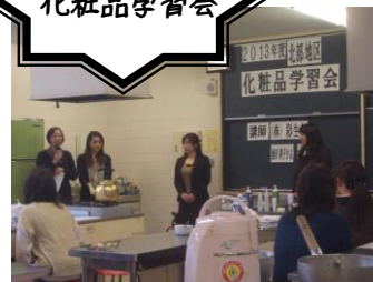
みんなできれいになりました

12月9日相浦文化センターで、水の彩メーカーの『彩生舎』を講師に、正しいスキンケア、乾燥対策、ハンドマッサージの方法など教えていただきました。カタログに載っている商品を実際に手にとることによって、より効果のある使いかたや商品の良さを実感しました。参加者からは『とても有意義な楽しい学習会になりました。』と感想がありました。