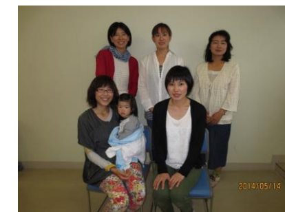
いつも元気な地区委員です