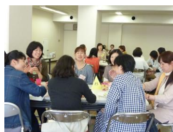
他の地区委員さんと交流できました