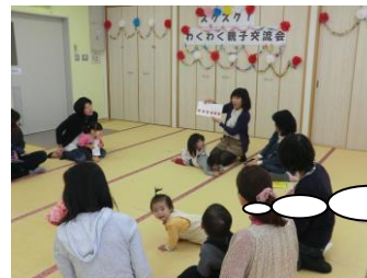
みんなで楽しく手遊び！

3月11日に大村子どもセンターで開催しました。子どもの大好きな手遊びや絵本の読み聞かせをし、グリーンコープのパンと産直びん牛乳の試食をしながら『グリーンコープの安心・安全・おいしさ』について話をしました。参加者からはとても美味しい♪と感想をいただき、親子で楽しく過ごした1日でした。