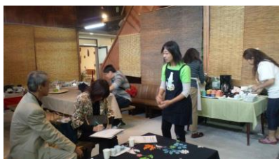
秋陶めぐりにて牛乳の試飲