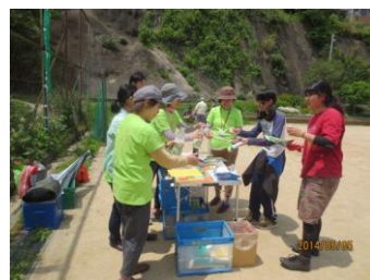
長崎南北地域でのイベント 「子どもまつり」の様子