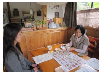
県北地域で出前おしゃべり会を開催しました